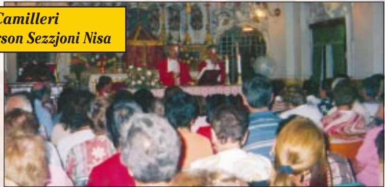
Il-membri tas-Sezzjoni Nisa waqt pellegrinaġġ u quddiesa li saru ġewwa l-Monasteru ta' Santa Katarina ġewwa l-Belt Valletta

Attivitajiet oħra jithabbru aktar 'il quddiem. Grazzi talli dejjem tattendu u tagħtu s-sapport tagħkom. Santa Katarina tkompli tharisna.