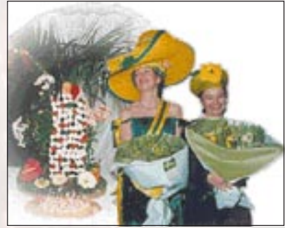
Żewġ Catherinettes bil-Kpiepel Tradizzjonali