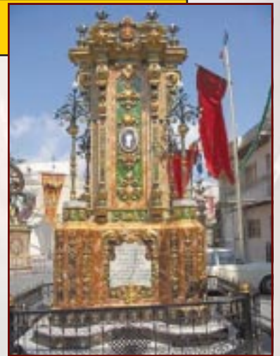
Il-Pedestall il-Ġdid fi Pjazza Mattia Preti