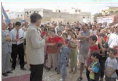
Il-President jindirizza lill-folla waqt il-Fjub Uffiċjali ta' Mabżen Santa Katarina

Illum wara li l-festa ta' Santa Katarina V.M. għaddiet, din il-biżà kollha taret mar-riħ u sfumata fix-xejn għax il-festa tal-Patrona tagħna Santa Katarina fis-sena taċ-ċentinarju kienet suċċess kbir li jisboq dak kollu li sar u nkiseb fil-passat. Bla ebda dubju l-entuzjażmu taċ-ċentinarju, bid-diversi attivitajiet soċjali, kulturali u reliġjużi li saru fil-paroċċa matul is-sena kollha, lahaq il-qofol tiegħu fil-festa ta' Settembru. L-attivitajiet li saru fil-ġimgħa ta' qabel il-festa, bil-partecipazzjoni tal-Banda Santa Katarina, komplew ziedu d-doża ta' l-entuzjażmu. Il-hruġ