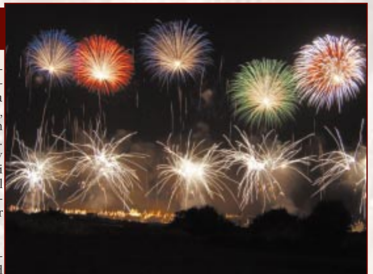
Spettaklu tan-Nar - Festa 2005