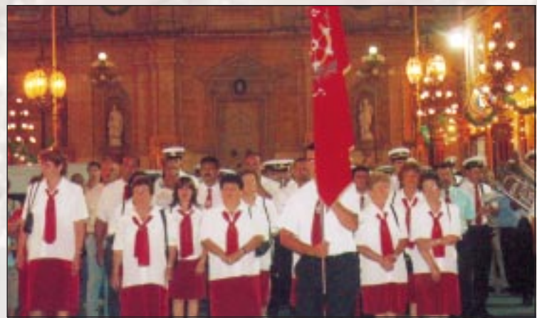
Il-Kumitat tan-Nisa flimkien mal-Banda Santa Katarina V.M. sejrin għall-inaugurazzjoni tal-Pedestall il-Ġdid

Bejn id-19 u l-25 ta' Novembru 2005 tistgħu terġgħu issegwu x-xandiriet permezz ta' RADJU SANTA KATARINA fuq il-frekwenza ta' 90.6FM, kemm l-attivitajiet li ser jiġu organizzati kif ukoll il-Funzjonijiet Liturġiċi kollha.