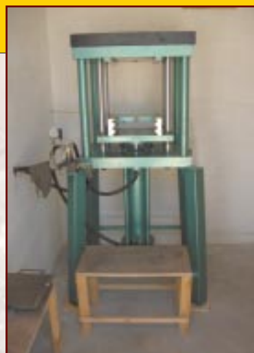
Pressa li nxtrat din is-sena biex tghin fix-xogħol tan-Nar

F'isem is-sotto kumitat nixtieq niringrazzja lil dawk kollha li hadu sehem u li attendew għall-attivitajiet li tellajna matul is-sena. Dawn l-attivitajiet kienu suċċess kbir għalina għax bihom investejna f'makkinarju u affarijiet ohra ta' siwi. Din is-sena, li hija s-sena taċ-Ċentinarju, qed tittella' attività kulturali jew soċjali kull xahar, fosthom il-musical 'Jisimni Katarina' li għamel suċċess kbir, grazzi għal dawk kollha li bihom seta' jittella' dan il-musical. Is-sotto kumitat jixtieq jagħ-laq billi nhe-ġġu lil kul-hadd biex jghin fil-ġbir ta' matul il-festi, u nawguraw festa mill-aqwa lil kulhadd. Grazzi mill-ġdid. Viva Santa Katarina V.M.