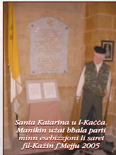
Santa Katarina u l-Kaċċa. Manikin użat bhala parti minn esebizzjoni li saret fil-Kaċċa f'Mejju 2005

It-taħhana Maltin kienu jiddependu hafna mir-riħ għal xogħolhom, tant li kellhom il-privileġġ jew il-permess tal-Knisja li jahdmu wkoll nhar ta' hadd u fil-festi kmandati, mingħajr ma jagħmlu dnuh. Iżda minkejja kollox it-taħhana Maltin ma kienu jahdmu qatt fil-festa tal-patruna tagħhom nhar il-25 ta' Novembru . La dak inhar u lanqas fit-3 ta' Mejju, fil-festa tas-Salib!