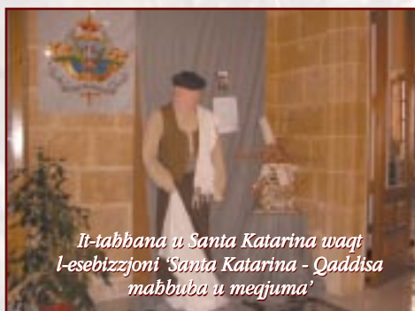
It-taħhana u Santa Katarina waqt l-esebizzjoni 'Santa Katarina - Qaddisa mabbuba u meġjuma'