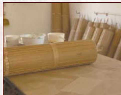
Parti mix-xogħol tan-nar għall-Festa 2005