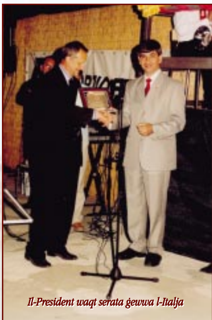
Il-President waqt serata ġewwa l-Italja