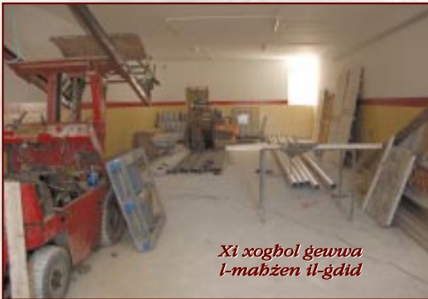
Xi xogħol ġewwa l-maħzen il-ġdid

■ Din hija t-tielet newsletter li qed tohrog ghas-sena centinarja 2005, sena li s'issa kienet mimlija daqs bajda b'attivitajiet kbar li żgur se jaghmlu unur lil dan ir-rahall sbejjah taż-Żurrieq, li sa minn dejjem kien iddedikat lill-Patruna taghna, il-kbira qaddisa Lixandrina, Santa Katarina V.M. is-sena mhux talli ghadha ma spiccatx, iżda gej il-qofol tač-čelebrazzjonijiet, sew f'Settembru u anke fix-xhur l-oħra, fejn naghlqu bil-kbir f'Novembru. Sena li żgur kienet imballata bix-xogħol għal hafna nies, u mhux inqas għalina l-kumitat ta' l-armor u daww kollha li jghinuna. Minn qalbi fisem il-Patruna taghna niringrazzjahom ghas-SAGRIFICĊJI KBAR li saru. Issa hu wkoll iż-żmien li noħorġu l-frott taghna u bil-ferħ kollu nħabbu żewġ attivitajiet li fihom se nżanznu żewġ proġetti kbar afdati lilna.