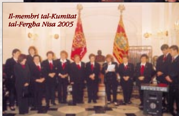
Il-membri tal-Kumitat tal-Ferġha Nisa 2005

tliet Bandalori ohra li se jkomplu jzejni Pjazza Mattia Preti. Fl-ahhar nett nixtieq nappellalkom sabiex min jista' jagħti xi għajjnuna rigward it-tindif fil-każin għall-festa javviċina lill-membri tal-Ferġha Nisa. Kull għajjnuna hija apprezzata hafna. Nawgura Festa u Centinarju mill-aqwa lil kulhadd u Santa Katarina Patrana tagħna ż-Zrieraq tkompli tharisna u tberikna.