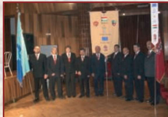
Il-Kumitat ġewwa s-Sala Jozsef Attila ġewwa Dorog - Ungerija, flimkien mal-Bandalora Kummemorattiva li ġiet ipprezentata wara l-Kunċert tal-Banda Santa Katarina V.M.

Sa minn dejjem qalbna habbitek, Sa minn ġuf ommna bik imsahħrin, Inti Biss il-patrona tagħna, ta' rabalna, U kburin li taħt KATARIN ismek ġejna mgħammdin. Il-Festa t-tajba lill-kulhadd, u VIVA SANTA KATARINA V.M.