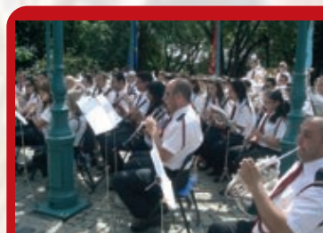
Il-Banda Santa Katarina V.M. waqt il-Kunċert fuq Fisherman's Bastion - Budapest