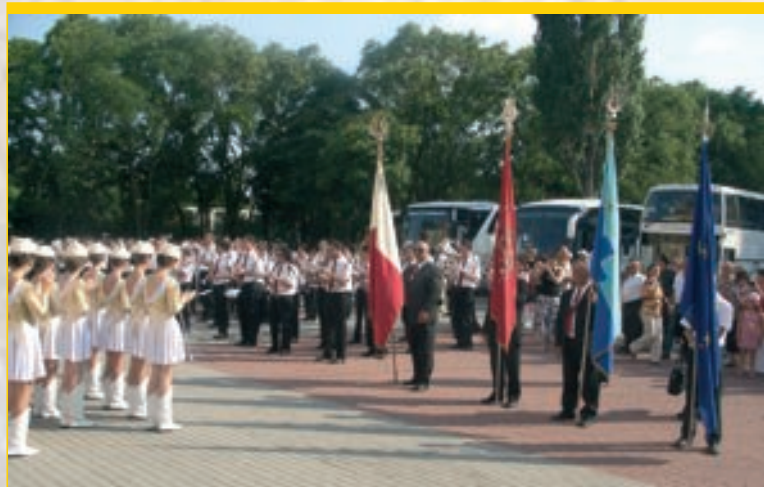
Il-Banda Santa Katarina V.M. flimkien mal-Majorettes li akkumpanjawha quddiem is-Sala Jozsef Attila ġewwa Dorog, l-Ungerija - Lulju 2009

Din is-sena l-Banda Santa Katarina V.M. nisġet holqa tad-deheb ohra fl-istorja tagħha. Dan wara li din il-Banda serviet t'ambaxxatriċi għal pajjiżna, din id-darba fl-Ungerija. Il-Banda għamlet 4 Kunċerti Mużikali mill-aqwa: f'Fisherman's Bastion, f'Balatonfured, quddiem il-Katidral ta' Esztergom, u fl-aħħar u mhux l-inqas il-kunċert tant mistenni mill-ġitanti u mill-oghla awtoritajiet ta' Budapest fiċ-ċentru Kulturali ta' Dorog. Il-Banda Santa Katarina V.M. qalghet applawzi kbar, u kliem ta' tifhir kbir minn kull min kien preżenti għall-kunċert. Il-Banda Santa Katarina V.M. tghożż dawn il-memorji mill-isbaħ ta' din il-mawra tagħha f'Budapest, u żżomm bhala tifkira l-banner li ġie preżentat lill-President tas-Sočjeta' u mlibbes mal-istandard ta' l-istess Banda. Is-Sočjeta' tghożż b'tant ghożża wkoll il-Bandalora Kommemorattiva li giet irregalata mill-Banda Ungeriza Dorog and Tat Wind Band lill-Banda Santa Katarina V.M. u din ser tingħaqad mal-5 bandalori precedenti l-ohra – tifkira memorabbli tas-sitt safriet barra minn Malta. Nawgura għal aktar suċċessi mill-aqwa lill-Banda Santa Katarina V.M. issa li riesqa l-Festa Titulari tal-Patruna tagħna Santa Katarina V.M. u tkun impenjata b'mod speċjali bil-Programm Mużikali tant mistenni fit-tieni jum tat-Tridu ġewwa l-misrah ewlieni tar-raħal – Misrah ir-Repubblika.