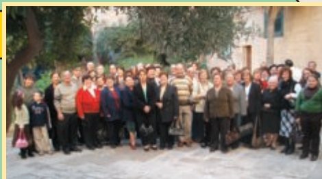
Harġa Kulturali ġewwa l-Palazz tal-President u l-Armerija tal-Palazz

Għal żmien il-Milied, kif inhu xieraq, morna naraw il-pantomima fl-Istitut Kattoliku. Kienet harġa divertenti u rilassanti u kull min ġie għaliha żgur li ma ddispijaċiehx. Niżgurawkom li għall-futur qrib għandna attivitajiet daqstant ieħor interessanti u edukattivi għalikom u l-familji tagħkom. Grazzi ta' l-inkoraggiment tagħkom. Inhegħgukom ukoll tergħu tiehdu sehem attiv f'dak kollu li norganizzaw biex nagħtu spinta lil kultura fir-raħal tagħna ż-Żurrieq.