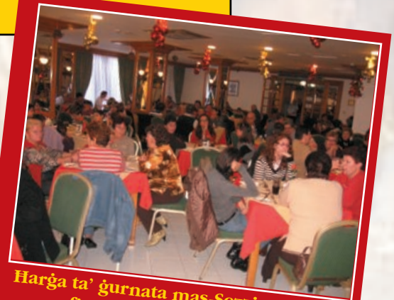
Harġa ta' ġurnata mas-Sezzjoni Nisa fit-8 ta' Diċembru 2008

Ejjew u hudu gost magħna u fl-istess hin tagħtuna kuragg inkomplu naghmlu proġetti kbar bħal ma dejjem għamilna bl-għajnuna tagħkom. Grazzi tal-appoġġ.