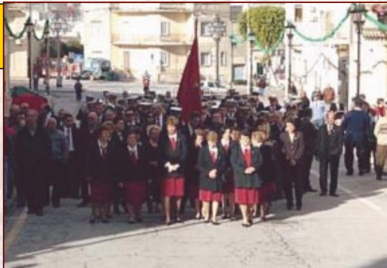
Is-Sezzjoni Nisa waqt il-Marċ li sar biex jakkumpanja lill-Prim Konċelebrant tal-Quddiesa Pontifikali li saret fil-25 ta' Novembru 2005