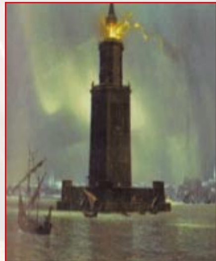
Il-Fanal ta' Pbaros

baqgħetx belt importanti u meta l-Franċiżi, immexxija minn Napuljun Bonaparte, waslu fuq ix-xtajtiet ta' din il-belt, sabu biss villaġġ tas-sajjieda. Kien fid-dsatax-il seklu, li Lixandra reġgħet bdiet tikseb popolarità bhala port kummerċjali. Min iżur Lixandra għandu jara hafna fdalijiet storiċi fosthom fdalijiet Rumani u anke Griegi.