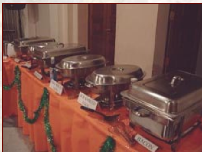
Ftit mill-ikel li kien bemm għall-Buffer Early Breakfast