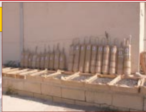
Xi xoghol tan-nar li se jinbaraq fil-Festival Nazzjonali tan-Nar

Għat-tieni sena konsekuttiva hadna sehem fil-Festival Nazzjonali tan-Nar li jsir fil-Port il-Kbir