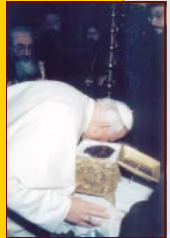
Il-Papa jbus il-fdalijiet tal-Ġisem ta' Santa Katarina V.M.