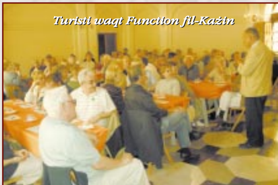
Turisti waqt Function fil-Każin