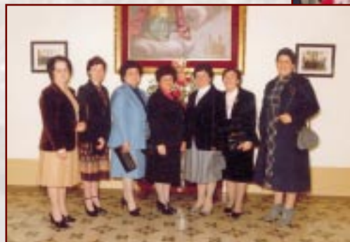
L-Ewwel Sezzjoni Nisa fiż-Żurrieq

Il-Ġimgha 25 ta' Frar aħna n-nisa kellna l-25 anniversarju mit-twaqqif ta' l-ewwel Sezzjoni Nisa fiż-Żurrieq. L-attivitajiet li organizzajna kienu suċċess u l-membri attendew bi għarhom. Waqt il-festin ta' l-okkażjoni li kellna fil-każin tagħna ġew mogħtija lilna diversi tifikiriet minn kull ferġha tas-soċjetà, u f'isem is-Sezzjoni Nisa niringrazzjakom.