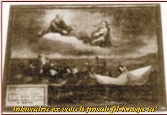
Inkwadru ex voto li jnsab fil-Knisja ta' Santa Katarina V.M. Żurrieq