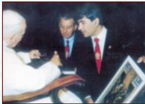
Il-President tas-Soċjetà Anibony Bonnici flimkien mal-Papa Gwanni Pawlu II

Ahna l-Maltin għandna verament għaliex inhossuna xxurtjati u kburin li l-Qdisija Tiegħu il-Papa Gwanni Pawlu II ġie fostna darbtejn. Kulhadd jibqa' jiftakar il-ferh li ġab miegħu il-Papa u kemm nies ġibed warajh minn kull fejn għadda. Niftakru