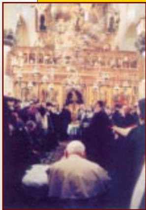
Il-Papa Ġwanni Pawlu II iqim lil Santa Katarina ta' Lixandra