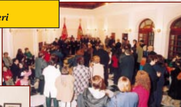
Il-membri nisa waqt festin li sar fil-Każin għall-25 Sena Anniversarju

Għal dawn it-tliet xhur li ġejjin ser inkomplu bl-attivitajiet tagħna: Il-Ġimgha 27 ta' Mejju - High tea il-Każin fis-7.00pm. Il-Hadd 5 ta' Ġunju - High Tea fis-St.George's Park Holiday Complex San Ġiljan fis-2.30pm. L-Erbgħa 6 ta' Lulju - Coffee Morning fil-Każin fid-9.00am.