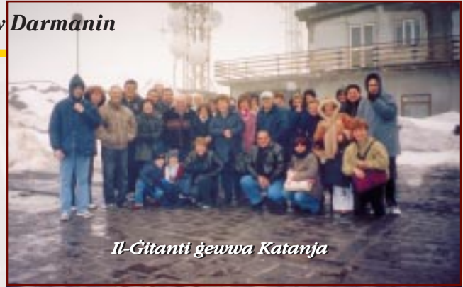
Il-Ġitanti ġewwa Katanja