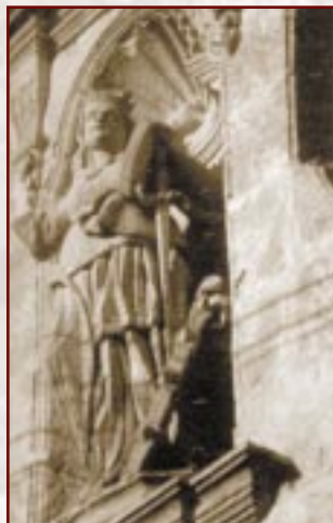
In-niċċa ta' Santa Katarina fir-razzett tat-Triq tal-Qrendi

U fl-ahhar insemmu wkoll xitla, jew ahjar sukkulent li jgħib l-isem tal-qaddisa tagħna. Din hi x-xewka ta' Santa Katarina magħrufa wkoll bħala Ewforbja tax-xewk u bl-Ingliż 'Christ's Thorns'. L-isem xjentifiku ta' dan it-tengħud hu Euphorbia milii slendens. Hi pjanta indigena tal-Madagaskar imma li sabet post tajjeb fil-qasri tal-btiehi u l-ġonna Maltin. Twarrad fjuri homor żgħar Prattikament is-sena kollha iżda l-iżjed fir-rebbiegha. Ix-xewk tagħha jfakkrek fis-snien tar-rota tal-martirju ta' Santa Katarina.