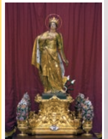
SANTA KATARINA V.M.