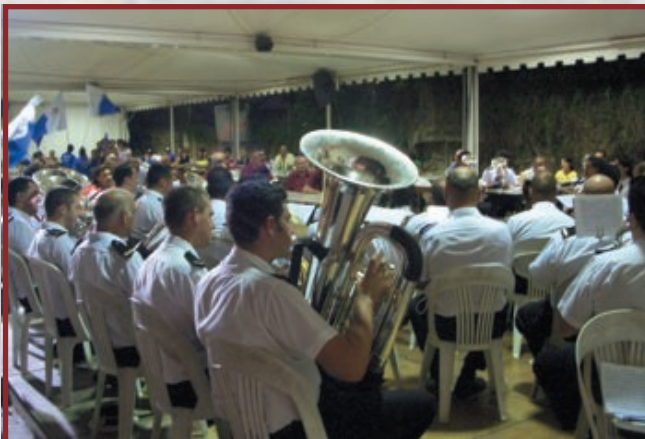
il-Banda ddoqq ġewwa tas-Sliema għall-festa tal-Madonna tas-Sacro Cuor

Nhar il-Hadd 5 t'Ottubru 2008 , il-Banda Santa Katarina V.M. tagħmel servizz ta' marċ u programm fl-okkażjoni tal-festa tal-Madonna tar-Rużarju ġewwa ż-Żurrieq. Il-marċ jibda fis-7.00pm kif toħroġ il-purċissjoni minn Triq il-Kbira, fejn wara tagħmel programm fi Pjazza Repubblika.