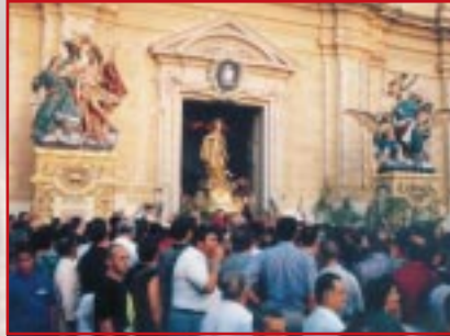
Il-Knisja Parrokkjali ta' Santa Katarina V.M. Żurrieq fil-Festa tal-Patrona tagħha

■ Meta l-Papa Ġwanni Pawlu II żar l-Eġittu fi Frar 2000, fid-diskors li għamel mal-wasla tiegħu fil-Kajr quddiem il-President Eġizzjan Mubarak, il-Patrijarca Kapt Stephanos, ix-Xejk Musulman Mohammed Sayed Tantawi, u l-poplu Eġizzjan, irrefera għal Santa Katarina ta' Lixandra bħala waħda mill-qaddisin kbar ta' l-Eġittu. Żied jghid ukoll li l-fama tagħha għadha hajja fil-qima ta' l-Insara u fl-isem ta' hafna knejjes fil-pajjiżi tad-dinja.