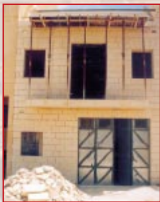
Il-faċċata tal-Mahżen il-ġdid

Inheggu biex min jixtieq itella' l-arbli ma jhallix għall-ahhar. Kulhadd jaf kemm inkunu mhabbtin għalhekk nitolbu li min jixtieq javvicinana biex intellgħulu l-arblu ma jagħmilx dan aktar tard mit-