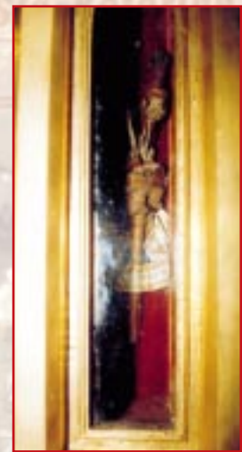
Ir-Relikwija ta' Santa Katarina V.M.