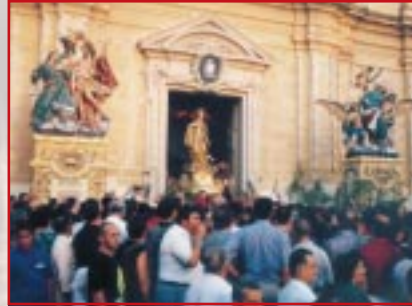
Il-Knisja Parrokkjali ta' Santa Katarina V.M. Żurrieq fil-Festa tal-Patrona tagħha

■ Meta l-Papa Ġwanni Pawlu II żar l-Eġittu fi Frar 2000, fid-diskors li għamel mal-wasla tiegħu fil-Kajr quddiem il-President Eġizzjan Mubarak, il-Patrijarca Kapt Stephanos, ix-Xejk Musulman Mohammed Sayed Tantawi, u l-poplu Eġizzjan, irrefera għal Santa Katarina ta' Lixandra bħala waħda mill-qaddisin kbar ta' l-Eġittu. Żied jghid ukoll li l-fama tagħha għadha hajja fil-qima ta' l-Insara u fl-isem ta' hafna knejjes fil-pajjiżi tad-dinja.