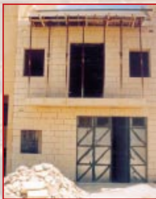
Il-faccata tal-Mabzen il-ġdid

Inheggu biex min jixtieq itella' l-arbli ma jhallix għall-ahhar. Kulhadd jaf kemm inkunu mhabbtin għalhekk nitolbu li min jixtieq javvicinana biex intellgħulu l-arblu ma jagħmilx dan aktar tard mit-