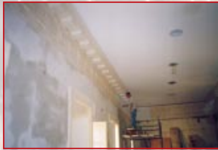
Ubud mix-xogħlijiet li saru fis-Sala Ġuzeppi Gauci

Il-parti ta' wara tal-Każin inbidlet kompletament fejn insibu sala ġdida. Giet imtejjba l-area tal-bar u s-sala tal-billiard. Barra minn hekk